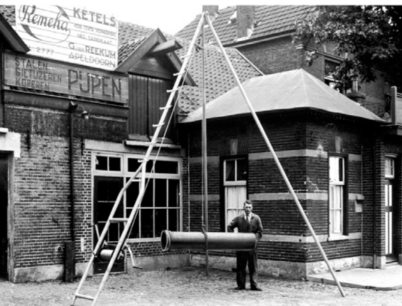
A kondenzációs kazántechnika